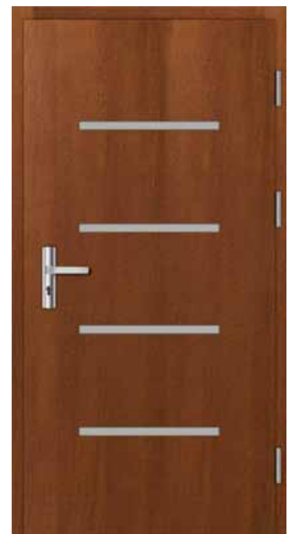
I18 (od wewnątrz)